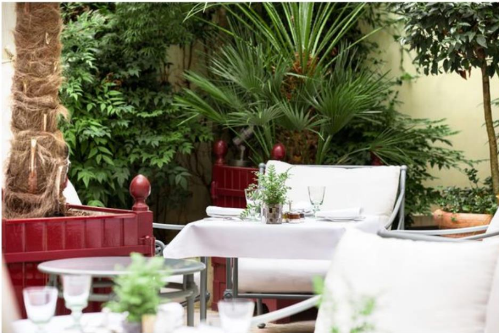
La réserve Paris, une belle terrasse à Paris